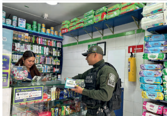
Jornadas de prevención del Gaula