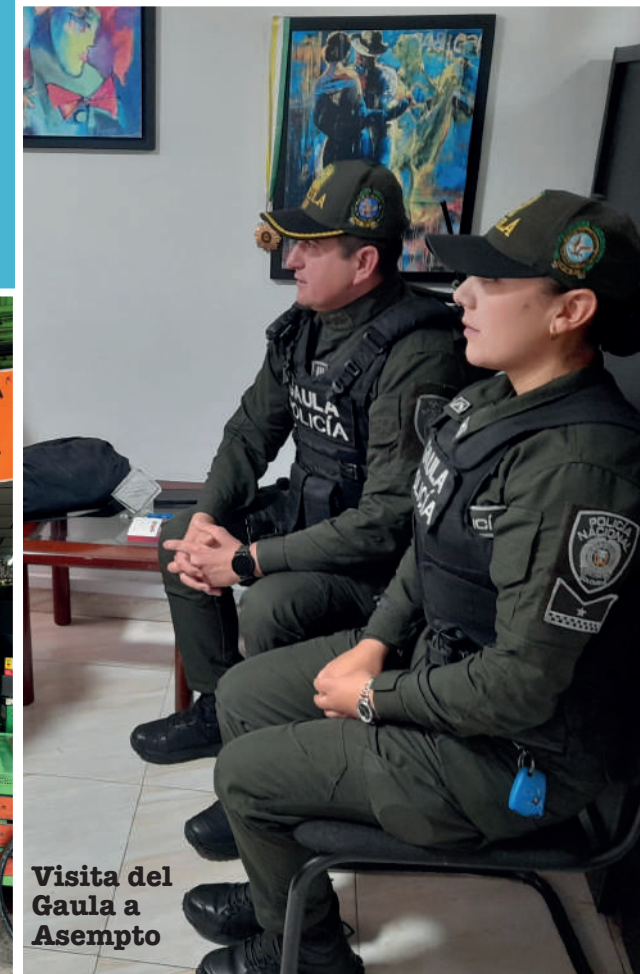
Visita del Gaula a Asempto

Como parte de la continuidad de esta iniciativa, se ha programado una nueva conferencia presencial para noviembre de 2025, cuyos detalles serán informados oportunamente.