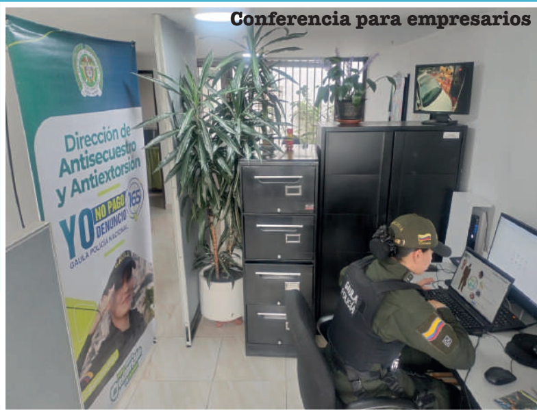
Conferencia para empresarios

Como parte de la continuidad de esta iniciativa, se ha programado una nueva conferencia presencial para noviembre de 2025, cuyos detalles serán informados oportunamente.