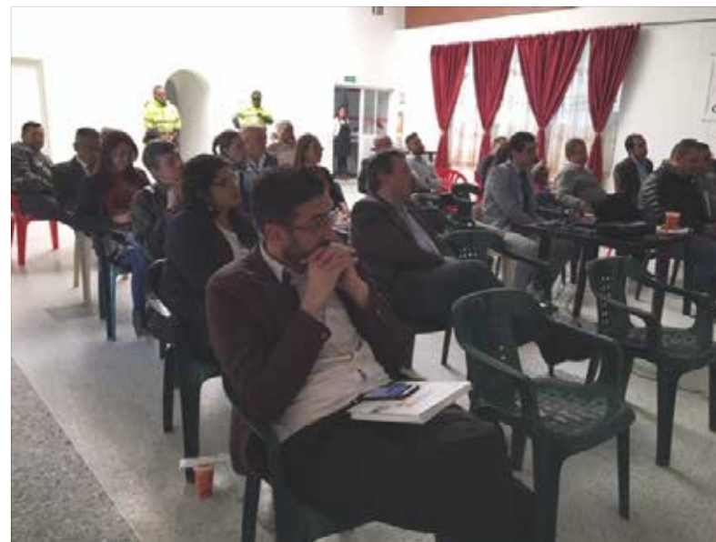
Última asamblea presencial realizada 2020