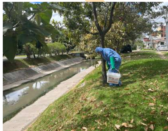
Trabajos de desinfección realizados por la Subrednorte