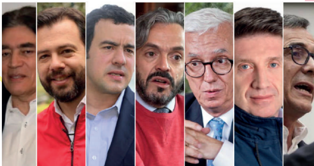
Candidatos para la alcaldía de Bogotá

Estudiemos los planteamientos de cada candidato y seamos críticos para darle nuestro voto al mejor. Por el que piensa en la ciudad, por la seguridad, por una persona trabajadora y honesta. Discutamos en familia la mejor opción, para elegir el aspirante adecuado y que más se acerque a resolver las necesidades de hoy. No desperdiciemos nuestro voto. Aun hay tiempo para inscribir su cédula o cambiar su lugar de votación.