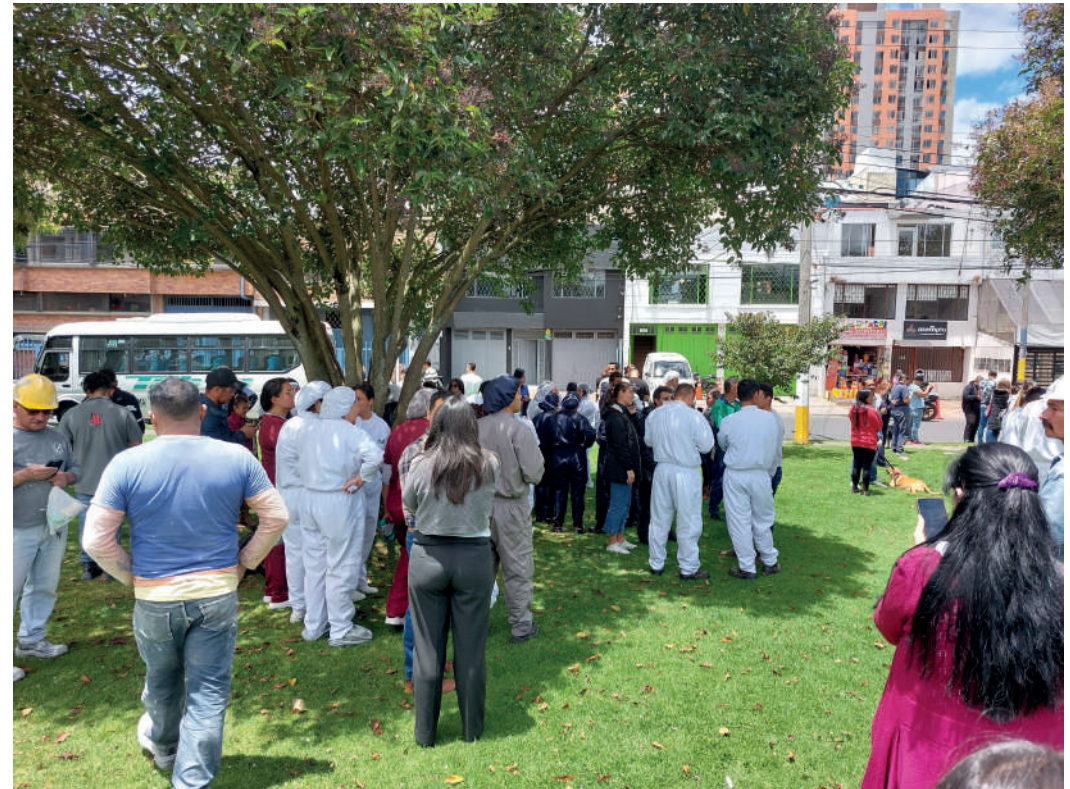
Evacuación real - 17 de agosto 2023