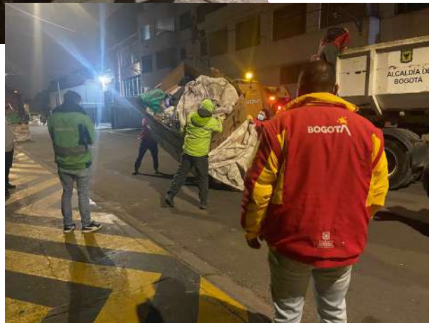
Policia en colaboración con alcaldía para limpieza del sector