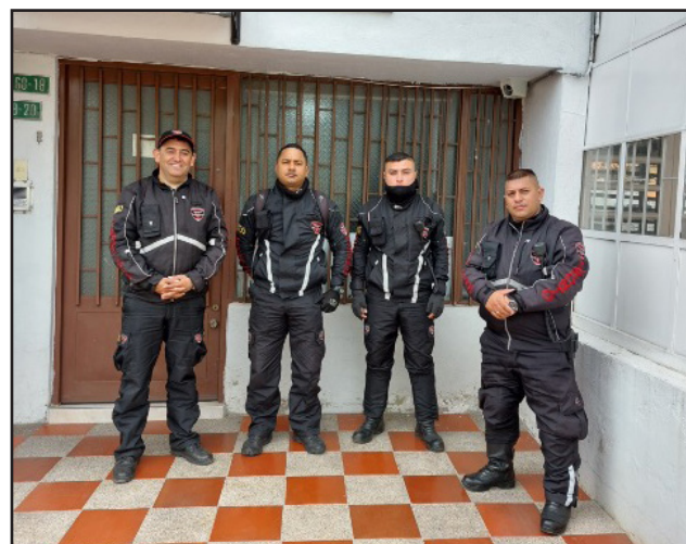
Guardas de Asempto