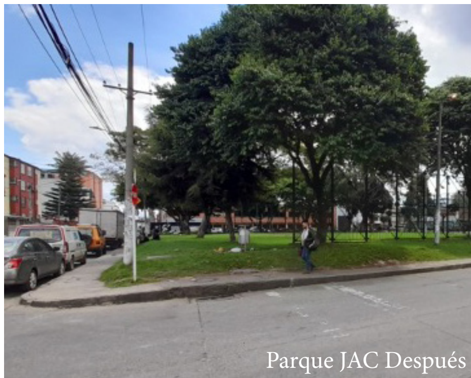
Parque JAC Después