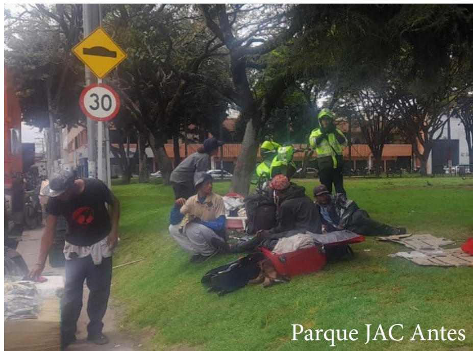
Parque JAC Antes

El 2 de febrero Asempto atendió la visita de dos funcionarios de la Alcaldía local, como respuesta a la solicitud radicada por la asociación en enero de 2023, con respecto a las inquietudes sobre seguridad, imagen y espacio público de Toberin. Se realizó una caminata por el barrio para explicar de manera directa y con evidencias, las problemáticas que están afectando la seguridad del sector. Los funcionarios tomaron atenta nota de los hallazgos: mala actividad de reciclaje, indigencia en parques, basuras en vías y zonas verdes, acumulación de escombros en andenes. A la fecha hemos comprobado atención especial a la convivencia de los indigentes en parques, pues fueron trasladados de esos espacios. Asempto continuará con el seguimiento a las actividades ordenadas, como resultado de esta visita.