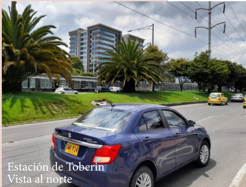
Estación de Toberin Vista al norte