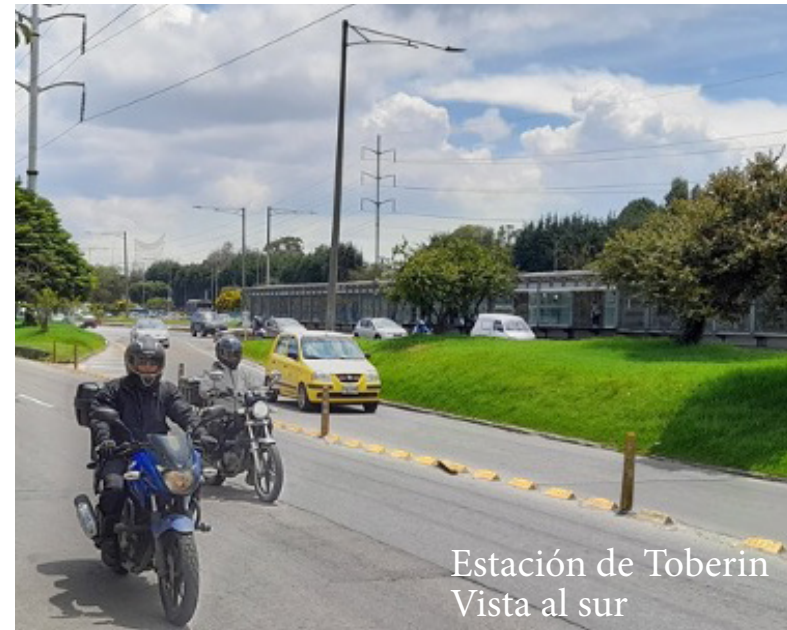
Estación de Toberin Vista al sur