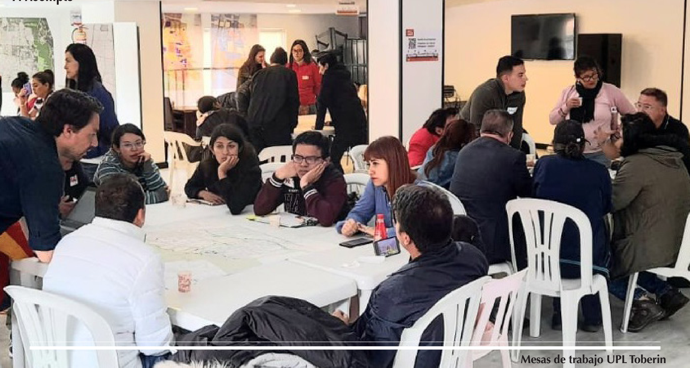
Mesas de trabajo UPL Toberin