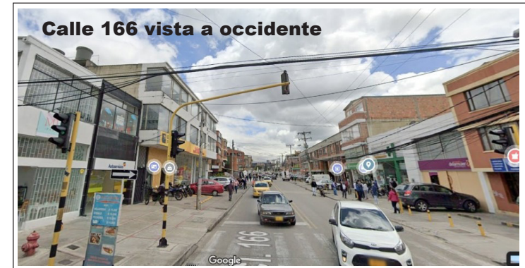
Calle 166 vista a occidente