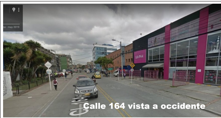
Calle 164 vista a occidente