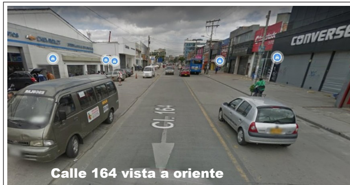
Calle 164 vista a oriente