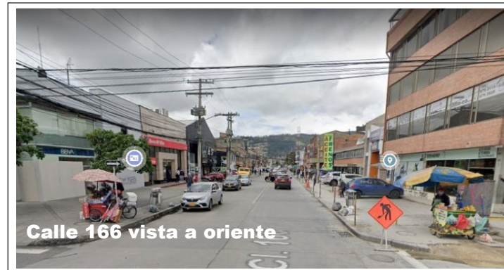
Calle 166 vista a oriente